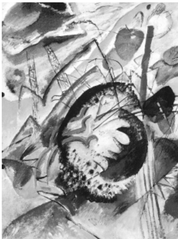
Figura 1. Wassily Kandinskij: Grande studio (1914). Kandinskij scopre l'energia nascosta nella materia e nella vita e gli dà forma sulla tela. "Fare arte" significa ri-partecipare al disegno della creazione ... assistere al flusso, infrenabile e spontaneo, di idee e di vitalità, che dalle profondità dell'io emerge alla luce della coscienza e si fa patrimonio di tutti.

Disposizione interiore alla poesia è oltretutto per il medico virtù professionale, perché consente di valicare i ristretti limiti di un approccio organicistico e tecnologico al malato, verso un rapporto ricco di sensi, capace di aprire le porte a nuove sintonie. Poesia è allora trovare le parole giuste, le metafore significanti per suscitare nel malato risonanze interiori che stemperino l'ansia di devastanti solitudini. L'animo si apre allora a percepire nel malato i segni di ciò che un occhio quotidiano non vede, perché mascherato dall'ansia. Sensibilità all'ascolto del mondo sconosciuto che il malato nasconde; capacità di vedere l'invisibile e di descrivere l'indescrivibile.