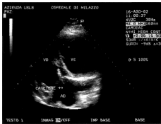
Figura 3. Sezione ecocardiografica 4 camere apicale che evidenzia il seno coronarico ectasico. AD = atrio destro; CS = seno coronarico; VD = ventricolo destro; VS = ventricolo sinistro.

Dall'approccio 4 camere apicale si è evidenziato un seno coronarico ectasico (Fig. 3); rilievo di per sé suggestivo di VCSSP. Probabilmente l'ectasia (30 mm) era così rilevante per l'assenza della VCSD. La diagnosi di VCSSP con ecocontrastografia è effettuata mediante iniezione di contrasto nella vena basilica sinistra con opacizzazione sequenziale dapprima del seno coronarico e successivamente dell'atrio destro 7,14 . Nel nostro paziente l'infusione di soluzione salina è stata effettuata nella vena basilica destra per escludere l'esistenza di una VCSD che, qualora presente, avrebbe determinato l'opacizzazione diretta dell'atrio destro e non attraverso il seno coronarico. La figura 4A mostra come il mezzo di contrasto iniettato nella vena basilica destra opacizzi solo il seno coronarico, mentre l'atrio destro viene raggiunto più tardivamente dal mezzo di contrasto (Fig. 4B).