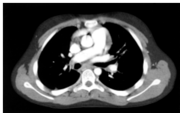
Figura 3. Tomografia computerizzata del torace con mezzo di contrasto: è visibile l'obliterazione parziale dei primi rami di diramazione delle arterie polmonari destra e sinistra con un coinvolgimento più marcato dei rami inferiori.

miglioramento del quadro clinico (scomparsa dei segni di stasi e dell'edema all'arto inferiore destro). L'ecocardiogramma alla dimissione evidenziò una riduzione delle dimensioni del ventricolo sinistro (diametro tele-