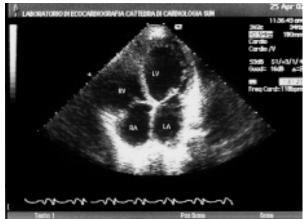
Figura 1. Ecocardiogramma bidimensionale (proiezione 4 camere apicale): è visibile la dilatazione delle 4 camere cardiache. LA = atrio sinistro; LV = ventricolo sinistro; RA = atrio destro; RV = ventricolo destro.

Il paziente, sottoposto a terapia con anticoagulanti, digitale, diuretici, ACE-inibitori (enalapril) e betabloccante (carvedilolo) a basse dosi, presentò un notevole