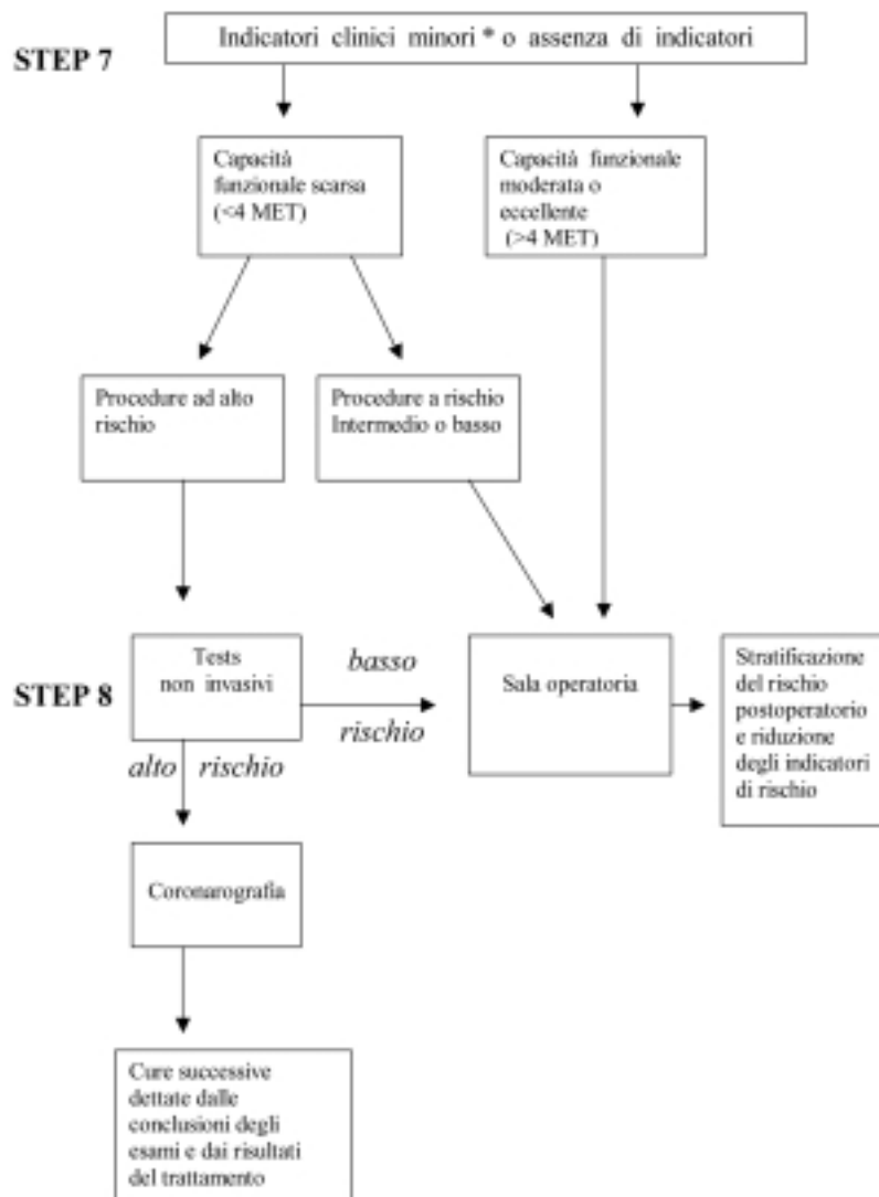
Figura 3. Modello multistep: step 7 e 8. * età avanzata, ECG anormale, ritmo non sinusale, capacità funzionale ridotta, storia di stroke, ipertensione sistemica non controllata.