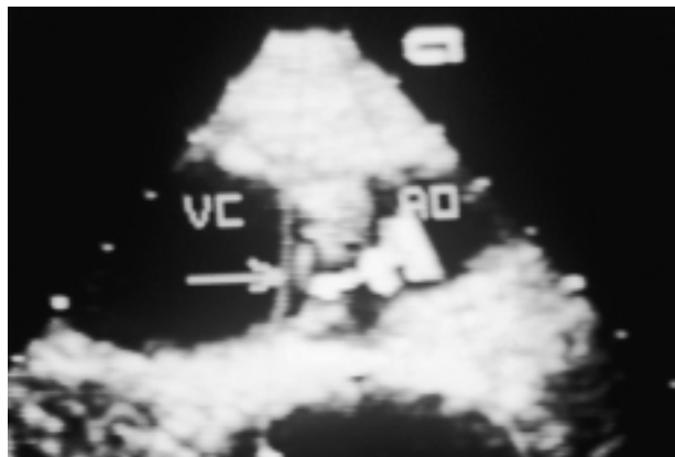
Figura 2. L'eco Doppler dei grandi vasi addominali evidenzia uno shunt (freccia) tra l'aorta addominale (AO) e la vena cava (VC) che appare dilatata.