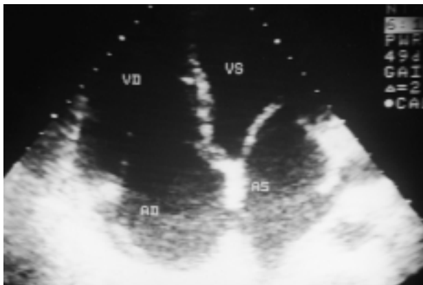
Figura 1. Proiezione 4 camere apicale che mostra la dilatazione di entrambi i ventricoli e degli atri. AD = atrio destro; AS = atrio sinistro; VD = ventricolo destro; VS = ventricolo sinistro.