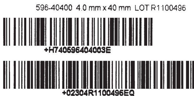
Figura 1. Codici primario e secondario secondo lo standard HIBC. Nel primo codice (codice primario) è possibile identificare il codice della ditta (H740) e il codice del prodotto (596-40400). Nel codice secondario l'anno e il giorno (304° giorno del 2002) e il numero di lotto (R1100496).

Il lettore Gryphon 100 è un lettore che divide con il computer la porta per la tastiera; non necessita dell'installazione di alcun software aggiuntivo e "mima" la digitazione manuale del codice (da ciò in emulazione tastiera), con affidabilità e velocità nettamente superiori. La profondità di campo va da una lettura a con-