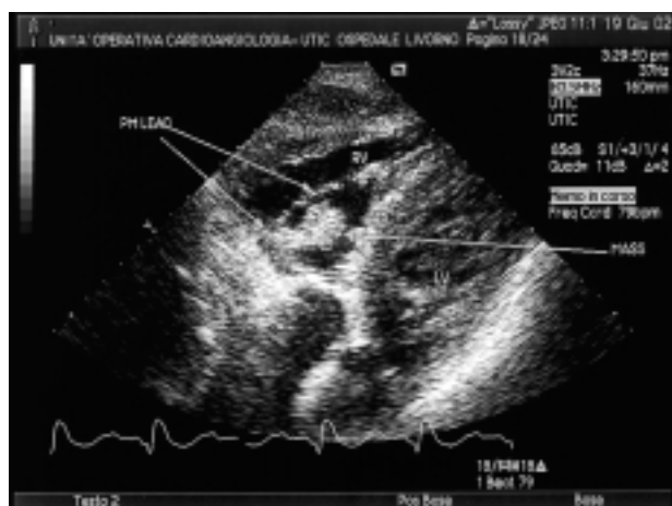
Figura 1. Ecocardiogramma (proiezione sottocostale). Le frecce a sinistra indicano l'elettrocatteter ventricolare (PM lead). La freccia a destra indica la vegetazione endocarditica (mass). LV = ventricolo sinistro; RV = ventricolo destro.

Il paziente è stato trattato inizialmente con fluconazolo, carprofen, teicoplanina, ciprofloxacina, e dicumarolici; per il