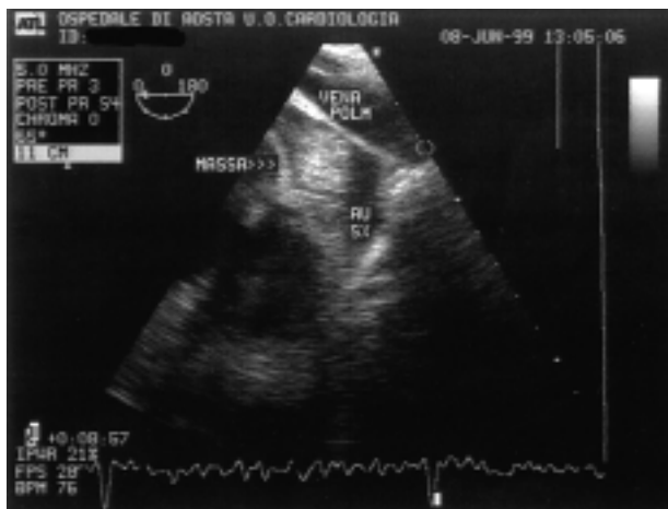
Figura 1. Aspetto ecografico transesofageo dell'auricola sinistra (AU SX) con massa al suo interno.