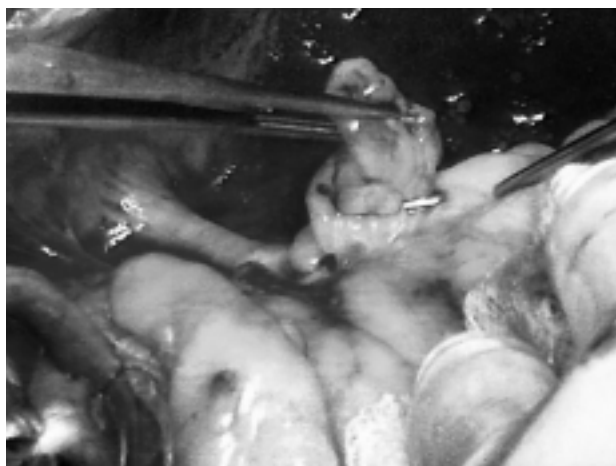
Figura 3. Foto intraoperatoria dell'auricola sinistra ipoplasica cui è stata applicata clip metallica.

Non si riscontravano trombi o altre masse patologiche all'esplorazione dell'atrio sinistro e delle vene polmonari. L'auricola ipoplasica veniva sottoposta a plicatura con clip metallica (Fig. 3) e ne veniva prelevato un campione per esame istologico. Il paziente restava asintomatico e veniva dimesso in buone condizioni generali. Il frammento prelevato è risultato costituito da tessuto miocardico ipotrofico e lievemente fibrotico rivestito da epicardio con focolai di infiltrazione linfocitaria e tessuto adiposo.