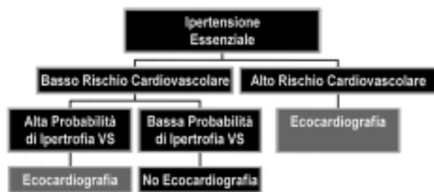
Figura 2. Indicazioni all'ecocardiogramma nel paziente iperteso secondo ANMCO-SIC-SIIA. VS = ventricolare sinistra.

Ecocardiogramma Ecografia carotidea duplex (fortemente raccomandata nei soggetti con almeno un altro fattore di rischio associato e/o con segni e/o sintomi di patologia dell'apparato cardiovascolare) Monitoraggio ambulatorio della pressione Esami raccomandati in caso di sospetto di cause identificabili di ipertensione (ipertensione secondaria)